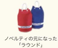
ノベルティの元になった「ラウンド」