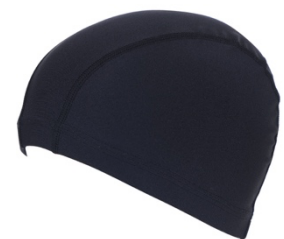
セットの水泳帽子

ロング丈フィットネス水着は、水泳帽子とセットで販売します。このセットを1度購入するだけで、水着・パッド・インナーショーツ・水泳帽子、プールで着用するものが全て揃うようにしました。プールに行くために様々なものを準備しなければならない手間を減らし、プールに行くことのハードルを下げられればと考えています。