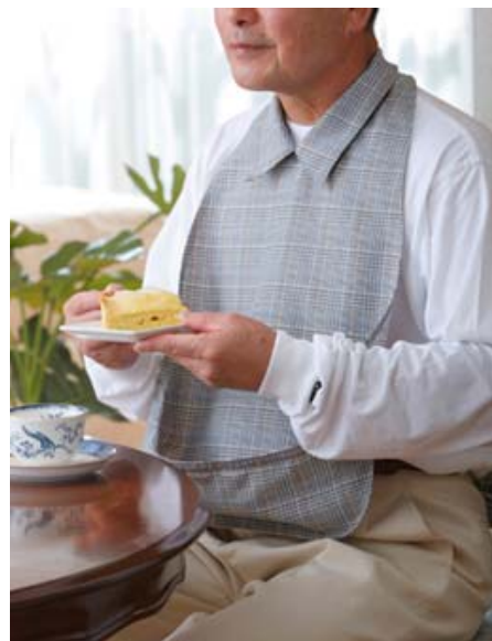
シャツタイプ・グレー(グレンチェック)