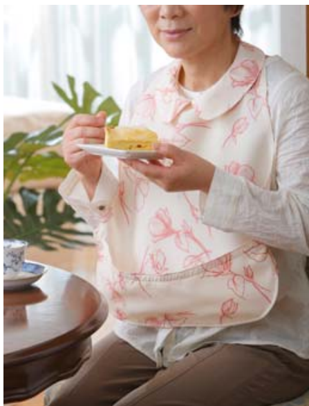
ブラウスタイプ・クリーム(花柄)

今回新発売する『うきうきエプロン 軽・サラ』は、1枚仕立てでありながら、生地裏表全体に施した超撥水加工(※)により、食べこぼしや水分をはじき、洋服を汚すことなく楽しくお食事ができます。先日行われました国際福祉機器展(H.C.R)でも大変ご好評をいただきました。